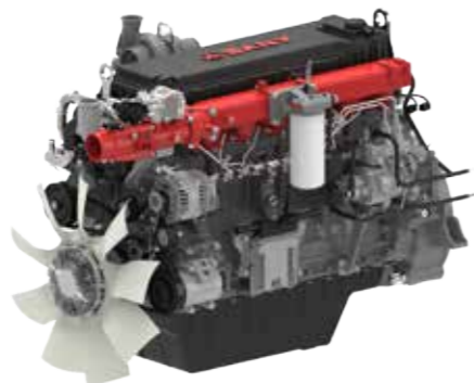
Двигатель SANY STG230C-8