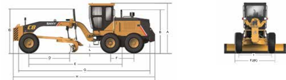
Технические характеристики автогрейдеров STG170C-8S STG190C-8S STG210C-8S STG230C-8S