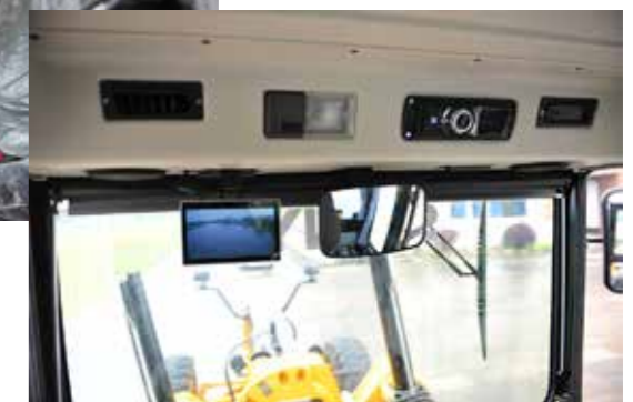
Радио, звуковое оборудование, камера заднего хода