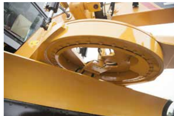
Рабочее устройство опорно-поворотного подшипника